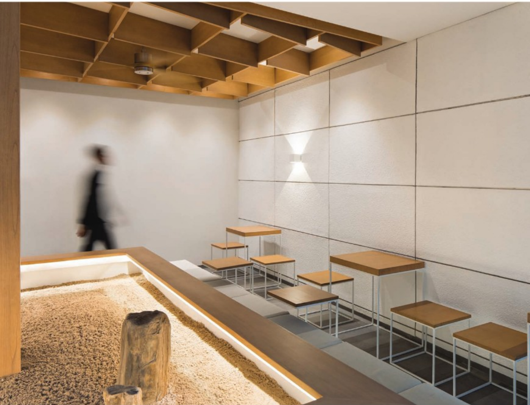
4_ 또 다른 내부 공간으로 진입하는 순간이다. 창을 설치해 공간을 분리하면서도 공간의 전체 흐름을 끊어내기보단 연속성을 주고자 했다. 자갈이 깔린 중정 부분이 그러한 의도에 가장 큰 역할을 한다.